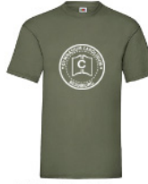
VWT - XL - 59 - g - w