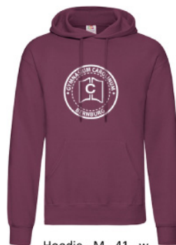
Hoodie - M - 41 - w