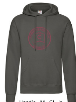
Hoodie - M - GL - b