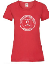
LVWT - L - 40 - g - w