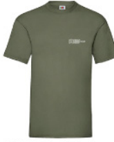
VWT - XL - 59 - k - w