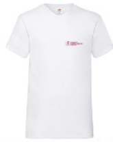
VWVNT - S - 30 - k - b