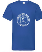
VWVNT - L - 51 - g - w