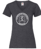
LVWVNT - L - HD - g - w