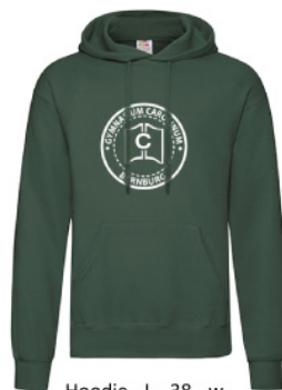
Hoodie - L - 38 - w