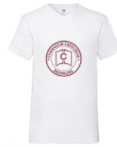
VWVNT - S - 30 - g - b