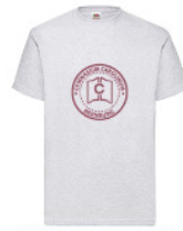
VWT - L - 94 - g - b