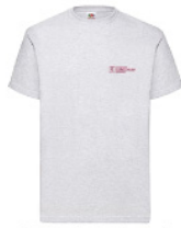
VWT - L - 94 - k - b