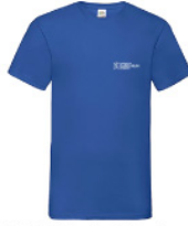
VWVNT - L - 51 - k - w