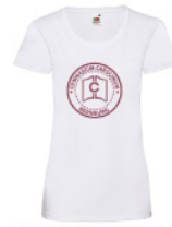
LVWT - L - 30 - g - b