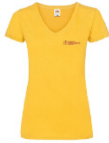
LVWVNT - S - 34 - k - b