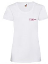
LVWT - L - 30 - k - b