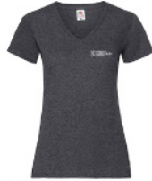
LVWVNT - L - HD - k - w