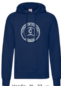
Hoodie - XL - 32 - w