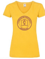
LVWVNT - S - 34 - g - b