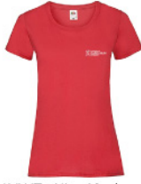
LVWT - XL - 40 - k - w